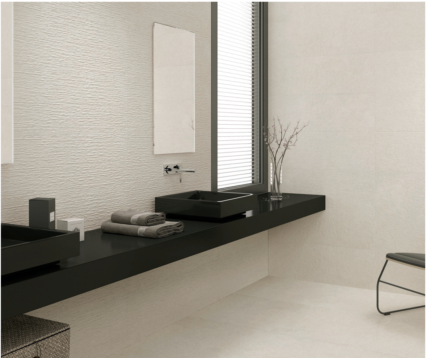
OS Slot Déco mat (Mur - côté gauche seulement)